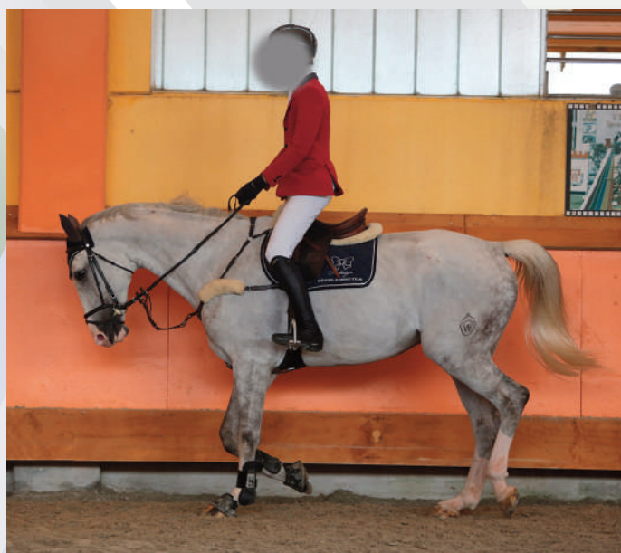
Corretta posizione del trotto sollevato nel tempo