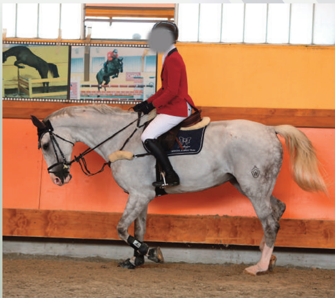
Corretta posizione del trotto sollevato nel tempo seduto

Curare in modo minuzioso la posizione al trotto sollevato è propedeutico al salto. Le spalle sono leggermente avanzate così che il cavaliere mantenga una leggera inclinazione del busto in avanti, che rimane la medesima sia nel tempo sollevato che in quello seduto. Questo permette una miglior discesa del ginocchio verso il basso e, di conseguenza, un corretto abbassamento del tallone.